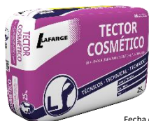
Fecha de fabricación y detalle del producto impreso en los laterales del saco